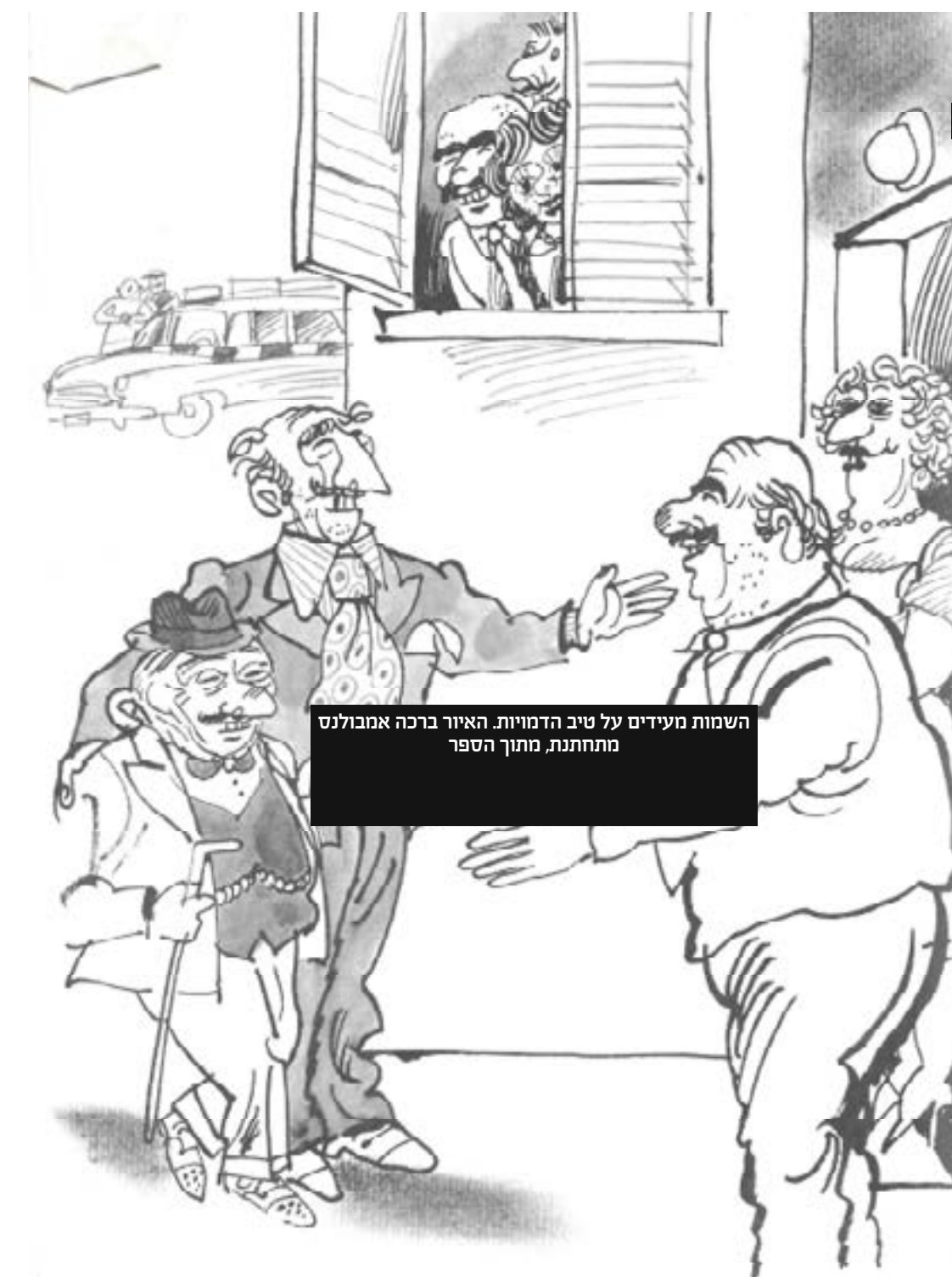
השמות מעידים על טיב הדמויות. האיור ברכה אמבולנס מתחתנת, מתוך הספר

"כשגבר היה גבר" וספר ההמשך שלו "הבנוכונים הכי יפים" הגיעו אחרי שורת ספרים לילדים, לנוער ולמבוגרים, שעסקו ברובם בהרואיקה ארץ-ישראלית ובתיעוד היסטורי-ספרותי. הם היו קדימון לפצצה הגדולה שהטיל בסוף שנות ה-70 כשהוציא לאור את "תמונות יפואיות", הספר הראשון בסדרה המבוססת על טורים ב"מעריב", עם איוריו של שמואל כץ. אחרי הגיעו "תמונות יפואיות - סיכום שני" (1982), "פופ סבאבה: תמונות יפואיות - סיכום שלישי" (1983) ו"פעמיים טורקי" (1986). באותה עת כבר היה ברור שתלמי, שנהג לחתום על טוריו לעתים בשמו המלא ולעתים בשמות הברזיים מ' סירי ומ' אחי-דודון, הוא המתעד הרשמי של הרוח שהי כתיבה שפה פתוחה, מצחיקה, דוקרת וכנה מאוד. השמות והכינויים, כמו אצל דיימון ראניון, מעידים