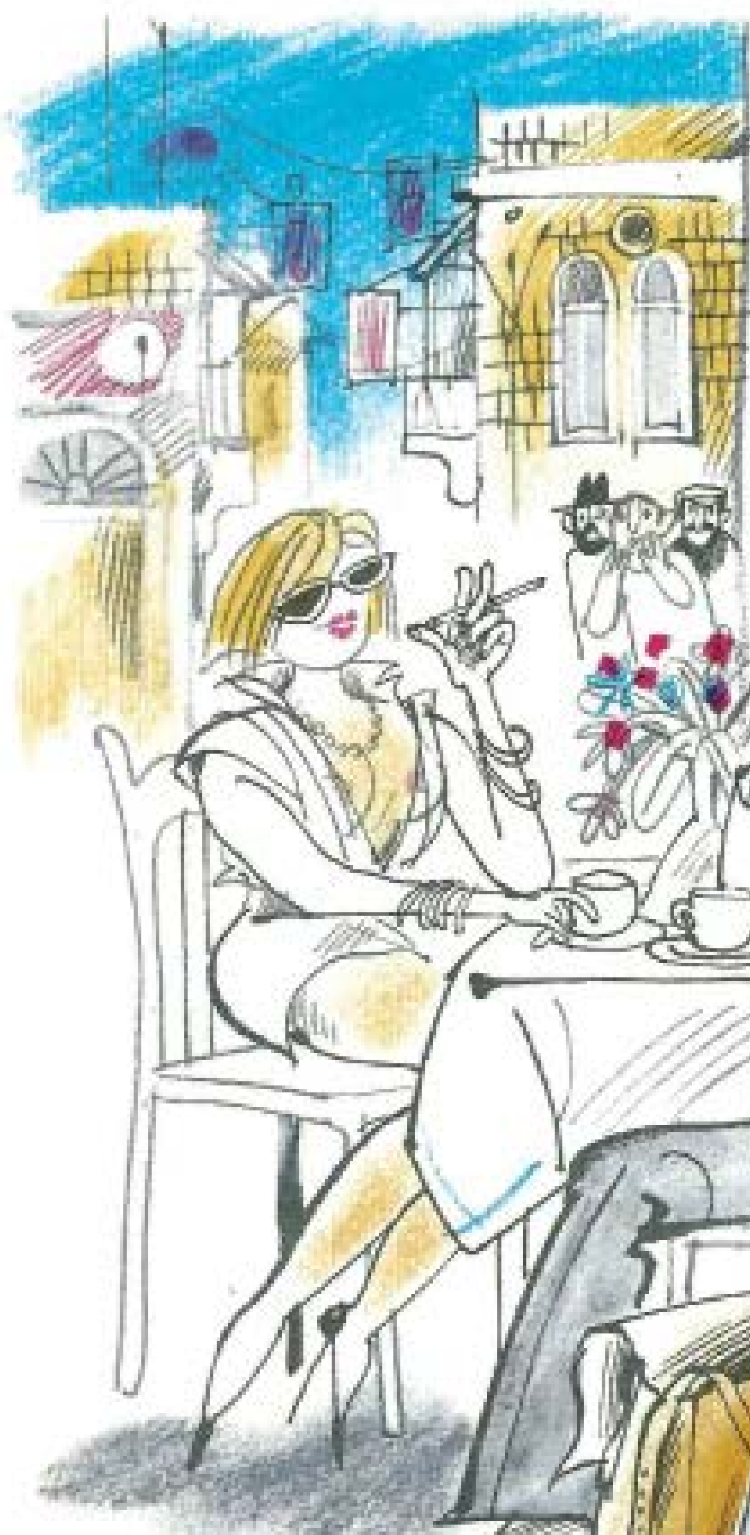
שפה פתוחה, דוקרת וכנה. איור מתוך הספר "יפו שבאבה: תמונות יפואיות - סיבוב שלישי"